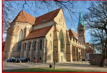
Augsburg, Dom und Rathaus

Mo 3. Juni: Anreise nach Augsburg (ca. 380 km) mit Zwischenstopp in Donauwörth, dort Besuch des Liebfrauenmünsters, dann weiter zum Hotel nach Augsburg.